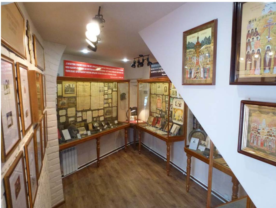
Экспозиция монастырского музея, посвященная священномученикам Курганской епархии.